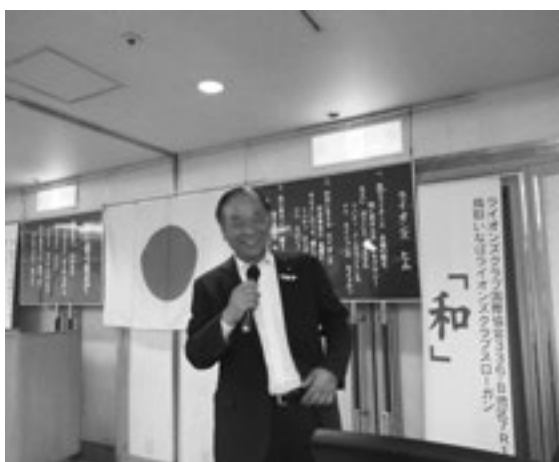
砂田会長 カラオケ