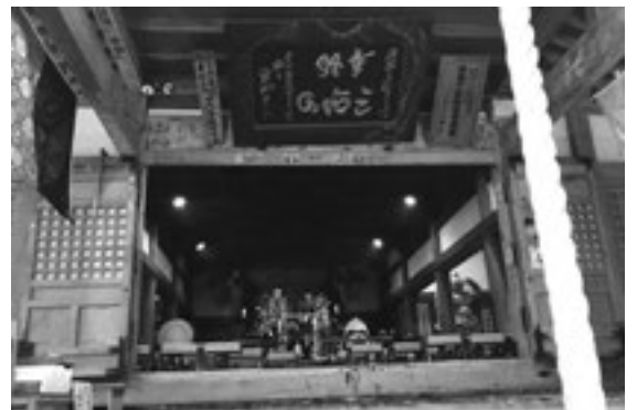
郡山開成LCとの三朝観光