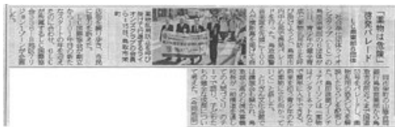
2018年4月16日（月）日本海新聞