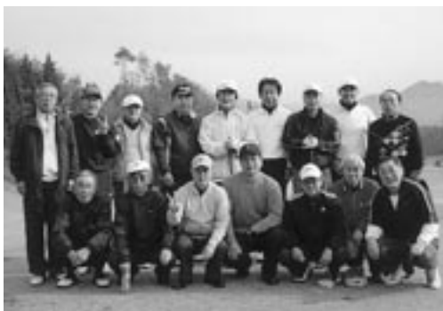
2009年2月22日 日本原CC 那岐コース