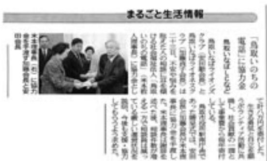
2009年2月25日付 日本海新聞