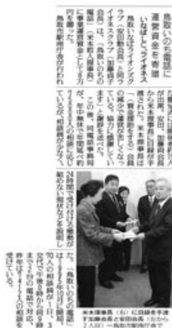
2009年2月27日付 読売新聞