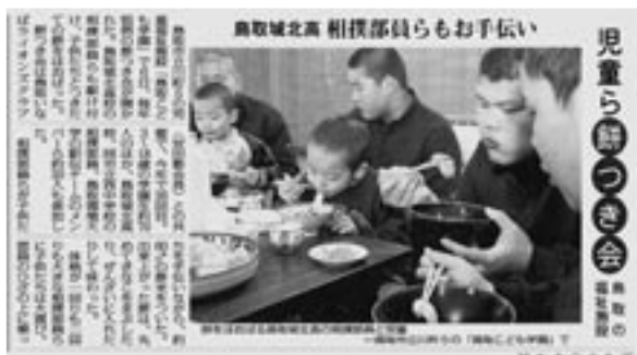
2008年12月7日(日)付 毎日新聞