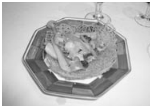
北京五輪にちなんだ鳥の巣