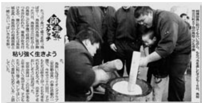
2008年12月7日(日)付 日本海新聞