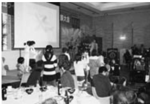
こどもさん達へのクイズ