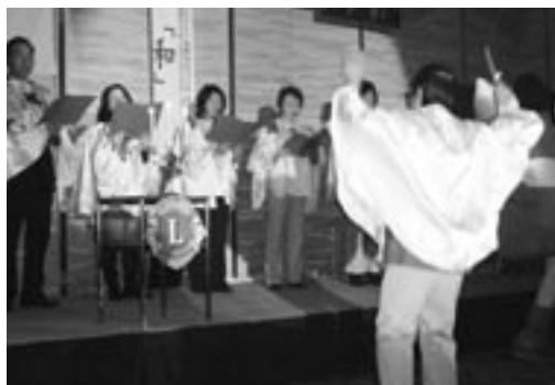
鳥取いなば2008 聖歌隊