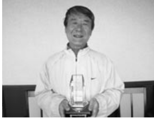
2008年12月例会成績表 12月14日(日)鳥取GC 砂丘コース