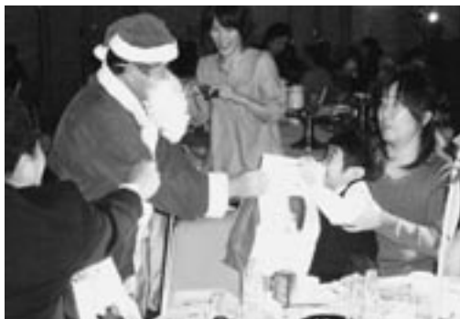
二副 永美サンタのプレゼント