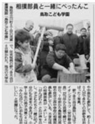
2008年12月9日(火)付 朝日新聞