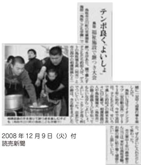
2008年12月9日(火)付 読売新聞