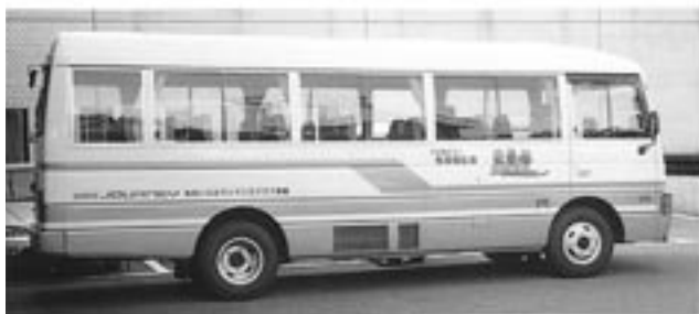
元 気 号