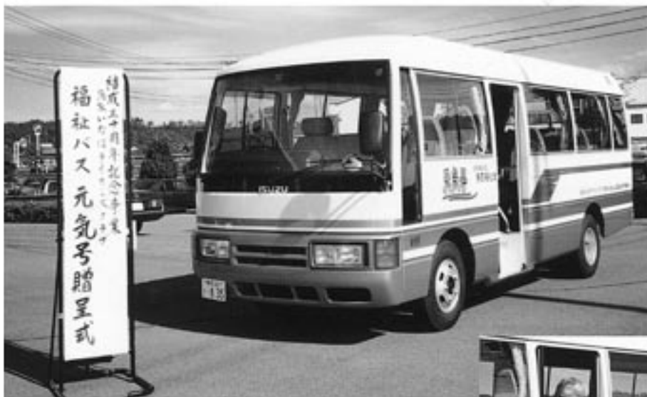
元 気 号