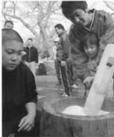
2007年12月3日付 朝日新聞