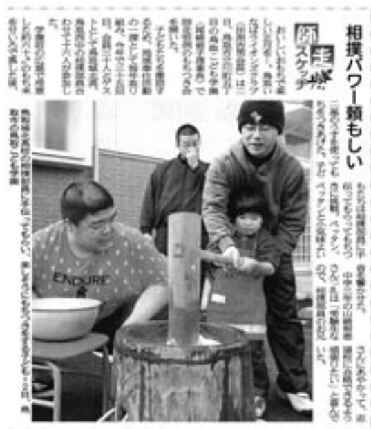
2007年12月3日付 日本海新聞

予定より1時間早く餅米60kgをつきあげて、体育館で子供たちとの会食と交流会が催された。相撲部の生徒さんへ子供たちが挑戦する相撲大会もあり、子供たちの歓声が響く、楽しい奉仕活動でありました。