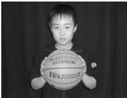
各参加チームに記念事業で進呈