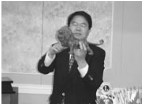
332 - D 地区ガバナー特別アワード