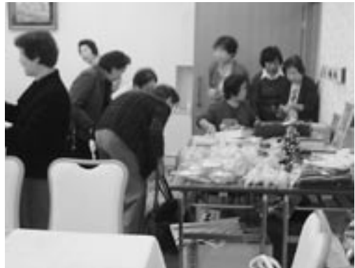
いつもの例会場が熱気ムンムンのバザー会場となり大盛況