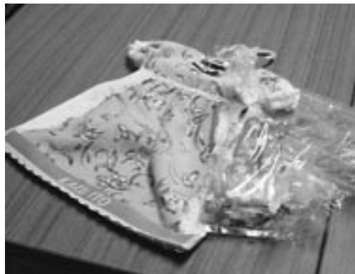
ものすごい競争率の中、ジャンケンで得た事務局の戦利品